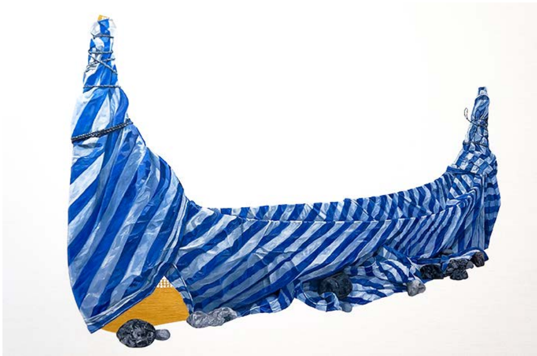
Idas Losin. Waiting to sail , 2016 / Esperando para zarpar , 2016. Óleo sobre lienzo / 80 x 105 x 5 cm. Adquirida el año 2018.

Queensland Art Gallery | Gallery of Modern Art Foundation. Colección: Queensland Art Gallery | Gallery of Modern Art, Brisbane, Australia. © Idas Losin