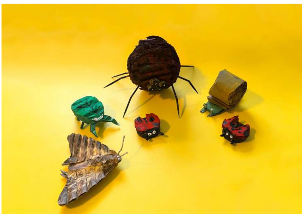
Equipo Educación CCLM

¡Listo! Ya tienes tu propio insecto. Ahora puedes tomarle una fotografía recorriendo tu casa, el jardín o donde tú quieras, incluso en tu cabeza.