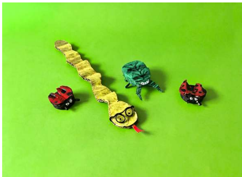
Equipo Educación CCLM