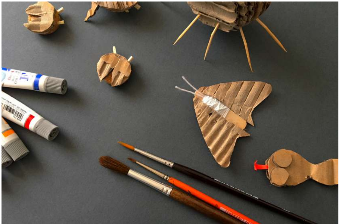
Equipo Educación CCLM

¡Ojo! Recuerda que no todos los insectos son redondos, así que puedes construir las formas que imagines.