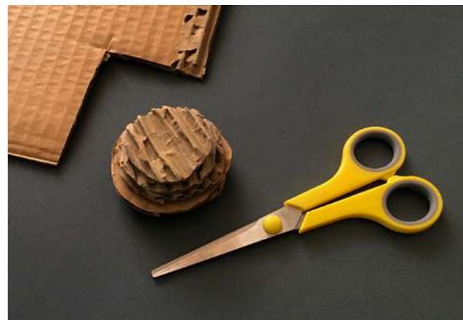
Equipo Educación CCLM