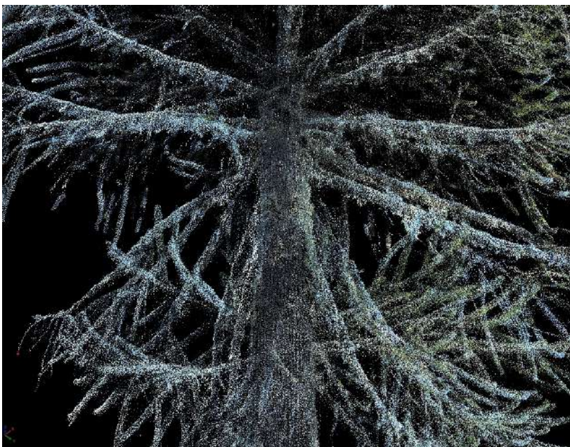
Araucaria en Bosque Pehuén . Imagen producida con scanner LiDAR (Laser Imaging Detection), 2020