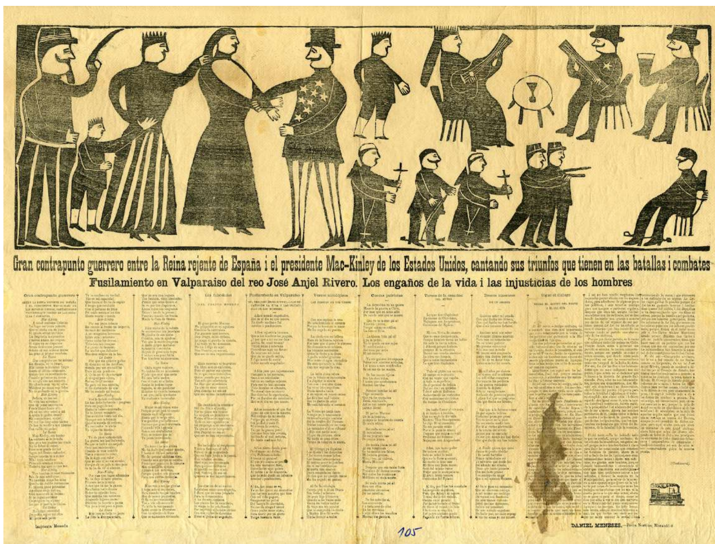
La Lira Popular. Anónimo. Gran contrapunto guerrero entre la Reina rejente de España i el Presidente Mac-Kinley de los Estados Unidos, cantando sus triunfos que tienen en las batallas i combates. Fusilamiento en Valparaíso del reo José Anjel Rivero. Los engaños de la vida i las injusticias de los hombres ; autor texto Daniel Meneses, julio, 1898. Biblioteca Nacional Archivo de literatura Oral y Tradiciones Populares.