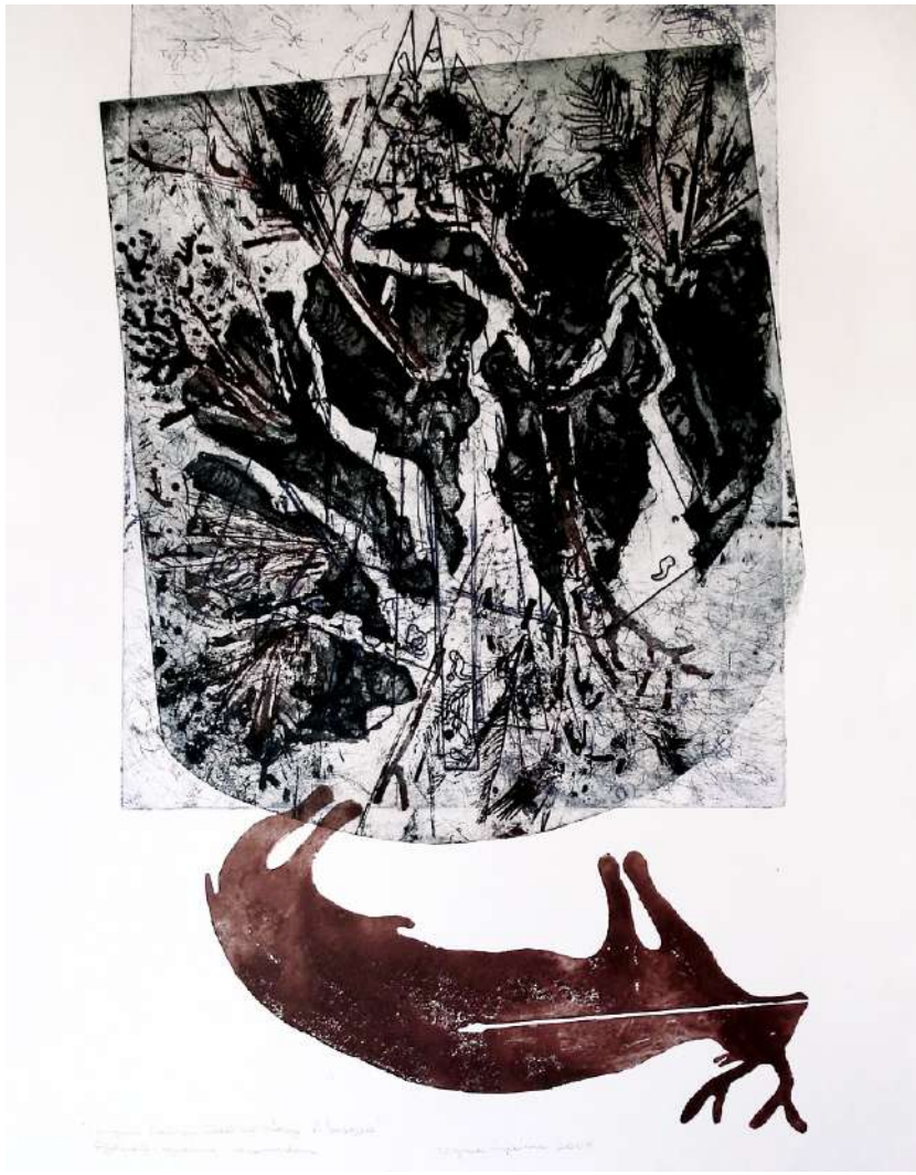
Virginia Vizcaino. Ninguna tranquilidad me otorga el bosque , 2003. Aguafuerte aguainta carborundum.