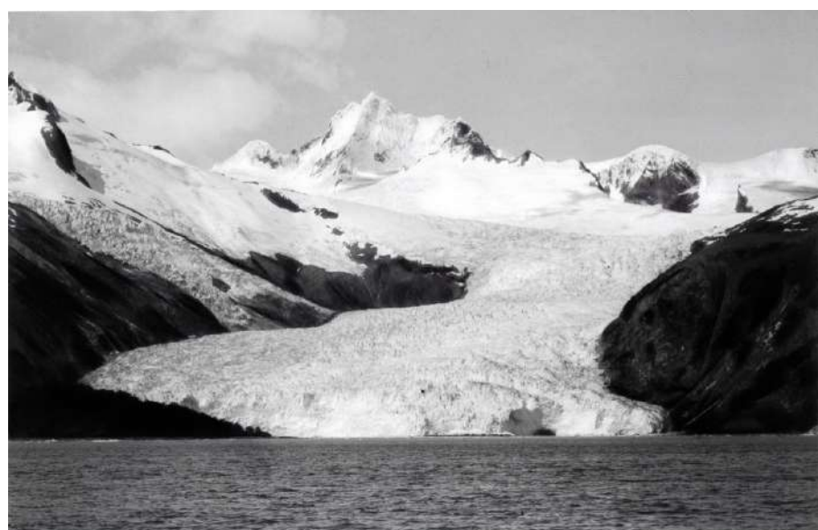
Fiordo Parry - Ventisquero y Monte Luis de Savoia. Autor desconocido. Fotografía. ©Museo Salesiano Maggiorino Borgatello.