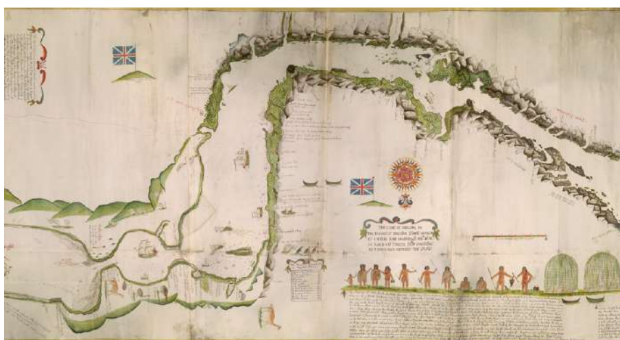
The land of Patagonia: &c. The draught of Magellan straits drawn by captain John Narbrough: Ann o. 1670: on board his Maiestis shipp Sweepstaks as I passed and repased the straits John Narbrough, 1671-1672. Mapa. Digital Store Maps K.Top. 124.84.8 TAB.END.