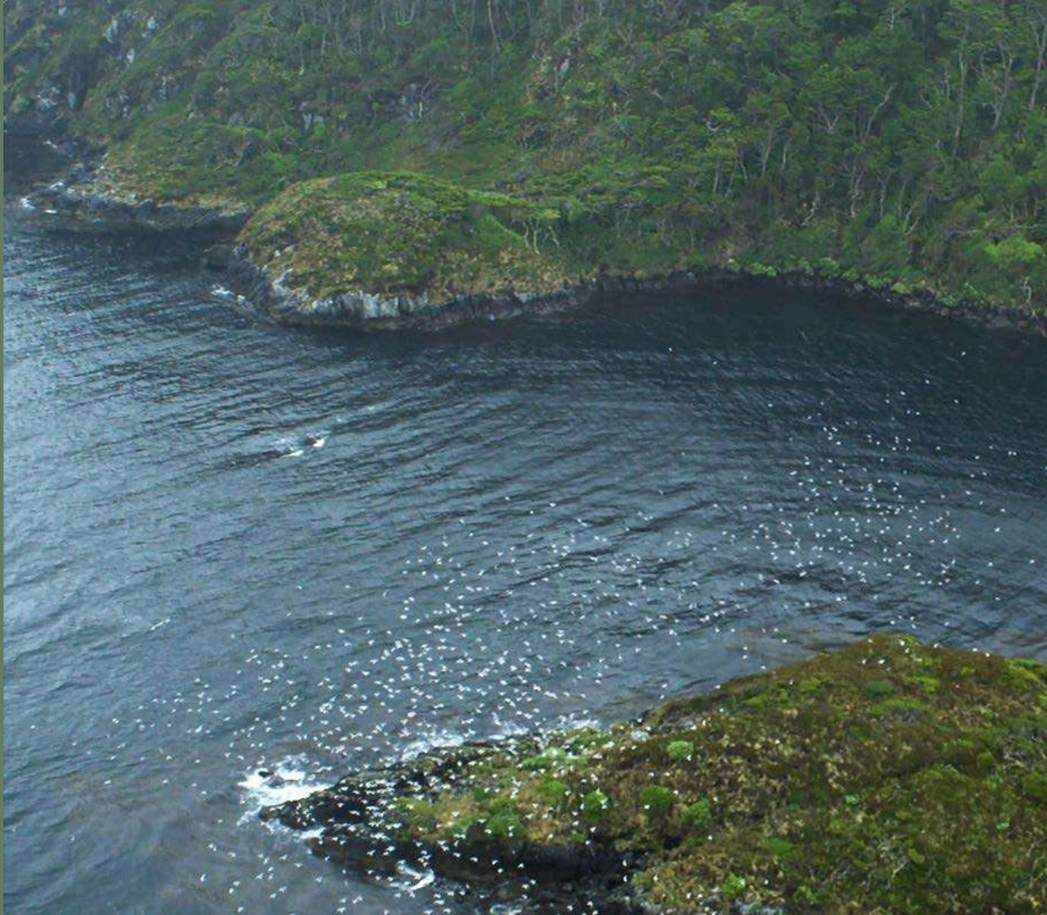
Vibrante. Entre punta Dungeness y Cruce Pollard. Francisca Montes, 2021. Película, 152 minutos.