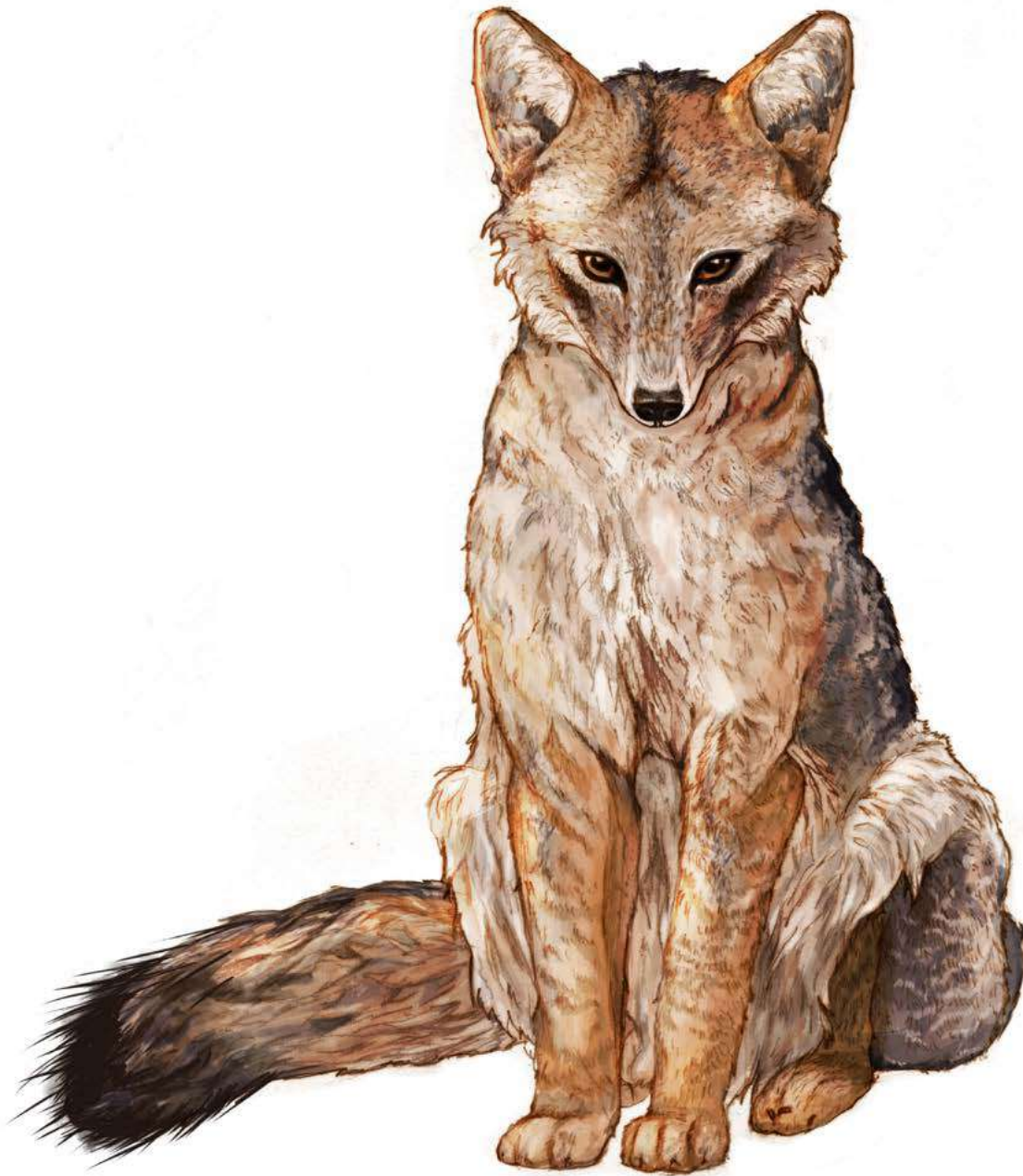
Zorro culpeo ( Lycalopex culpaeus magellanicus ). Antonia Lara G., 2019. Ilustración en técnica mixta.