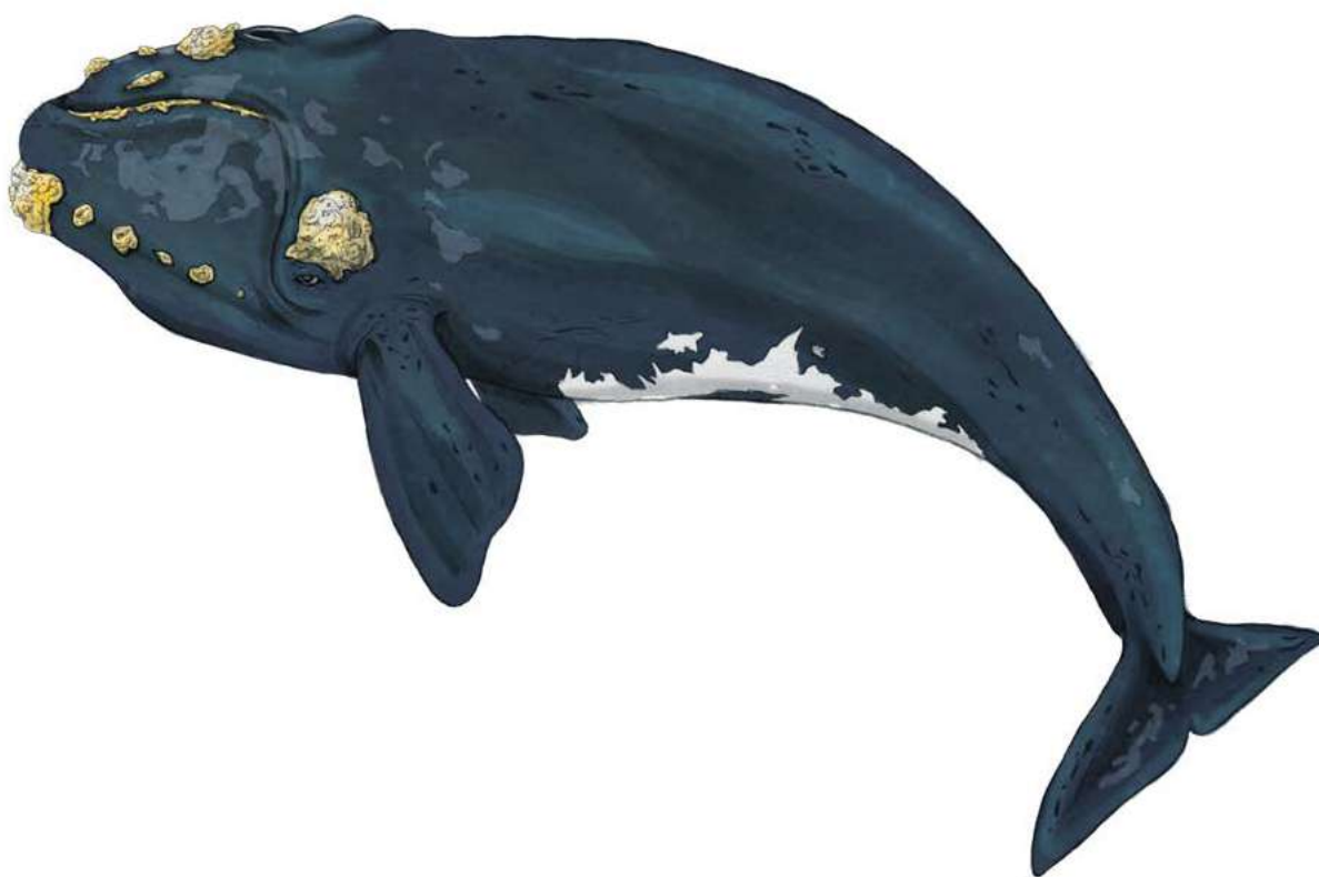
Ballena franca austral ( Eubalaena australis ). Antonia Lara G., 2014. Ilustración en técnica mixta.