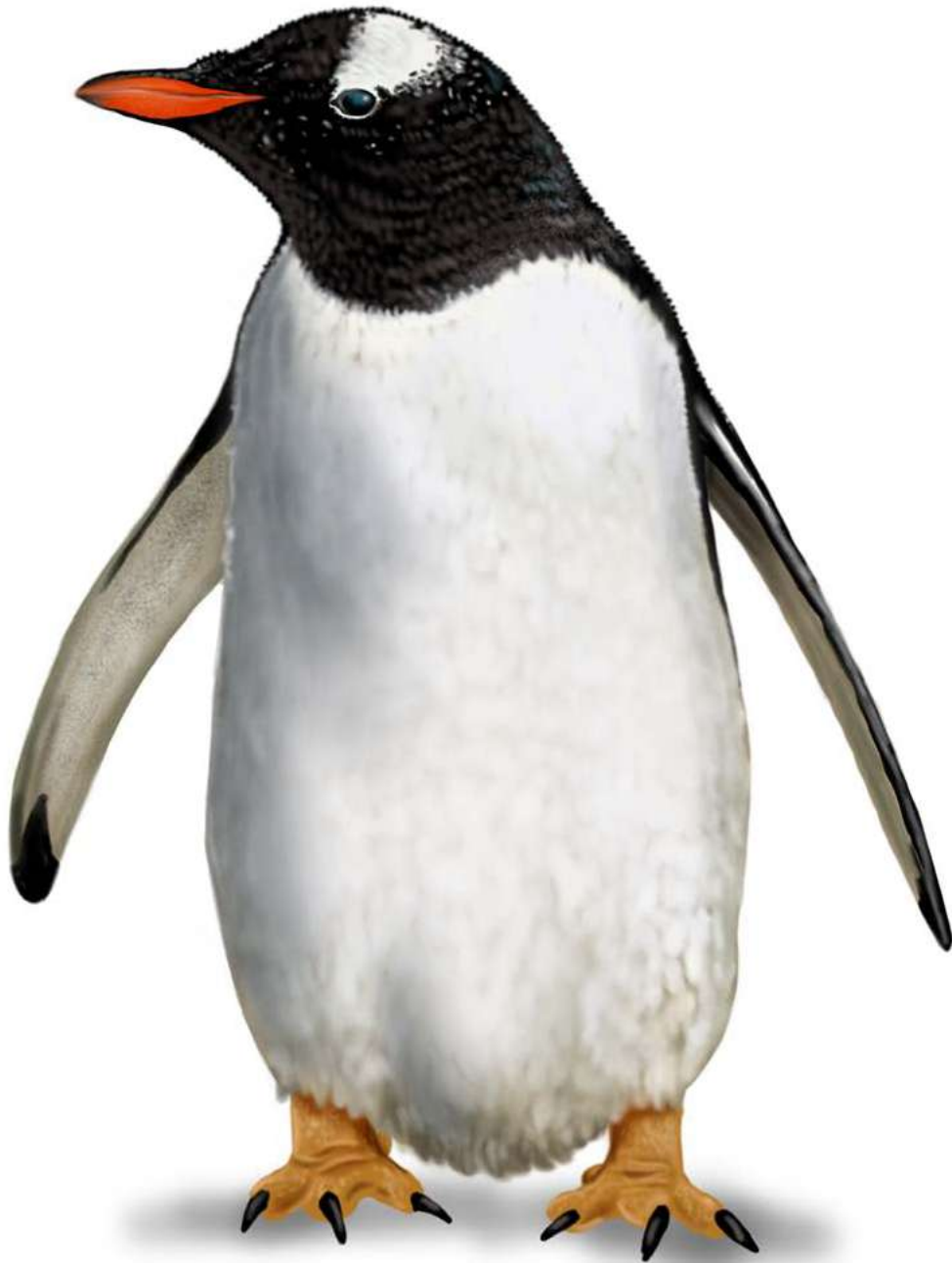
Pingüino papúa ( Pygoscelis papua ).

Rodrigo Verdugo Tartakowsky, 2020. Ilustración digital.