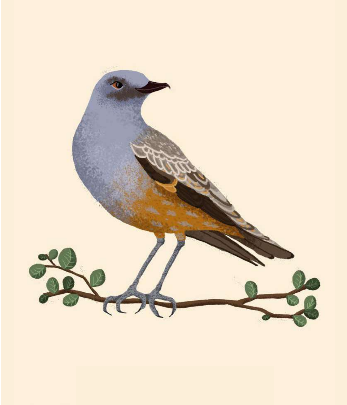
Caza moscas chocolate ( Neoxolmis rufiventris ). Daniela William, 2021. Ilustración digital.